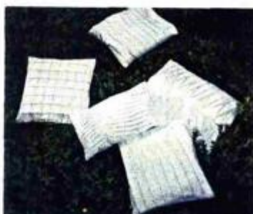
Grupa: Jastuk »Pilot«