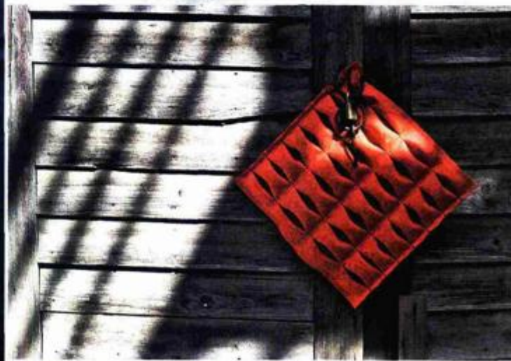
Predmeti Svjetlane Despot: Jastuk, kutijice, stolica

Likovnost: Hrvatski dizajneri će u petak i subotu predstaviti i prodavati vlastite proizvode, ali i popravljati stare i oštećene predmete koje građani dan prije donesu u MSU