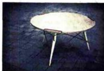
Stol »KT« skupine Numen